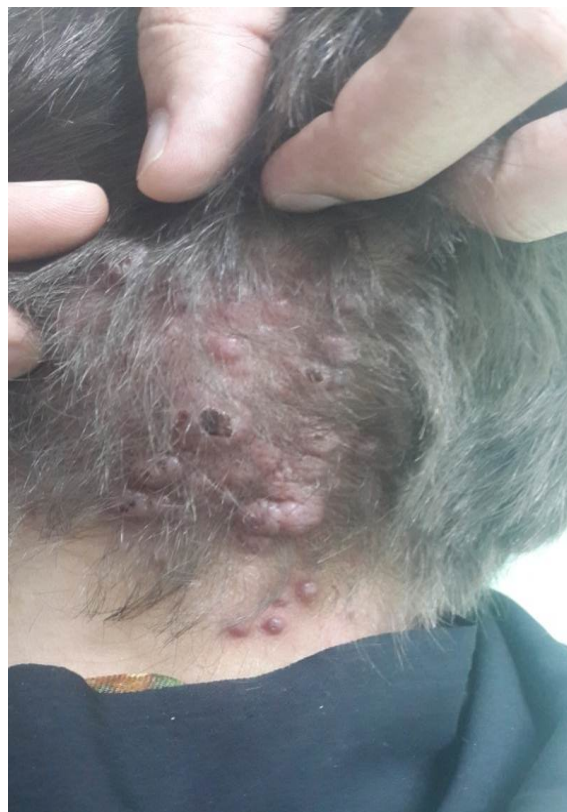
شکل ۱: پاپول ندول‌های اریتماتوی متعدد در ناحیه‌ی پس‌سری که برخی ضایعات به‌علت خارش دچار خونریزی سطحی شده‌اند.

هر ضایعه ابعادی بین ۰/۵ تا ۱ سانتی‌متر داشت و به‌علت خارش مزمن، پوست اطراف ضایعات لیکنیفیه شده و برخی ضایعات نیز زخمی شده بود. علائم حیاتی بیمار طبیعی بود و به‌جز خارش خفیف تا متوسط شکایت بالینی دیگری نداشت. بیمار سابقه‌ی بیماری سیستمیک، عفونت موضعی و تروما در ناحیه را ذکر نمی‌کرد. در سابقه‌ی مصرف دارویی بیمار، هیچ دارویی وجود نداشت. در ماه هشتم حاملگی دوم خود به‌سر