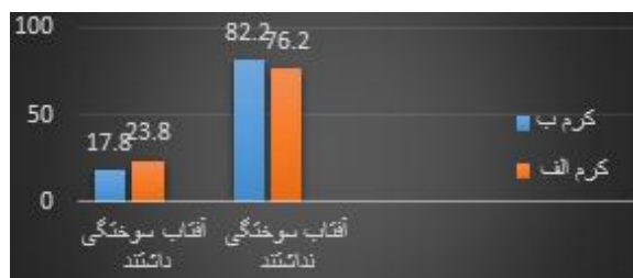
شکل ۲: میزان آفتاب‌سوختگی و پیشگیری از آفتاب‌سوختگی به تفکیک گرم‌های مصرفی