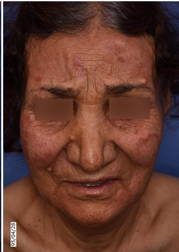
شکل ۱ الف: پلاک‌های انفیلتره و اریتماتو در هر دو گونه