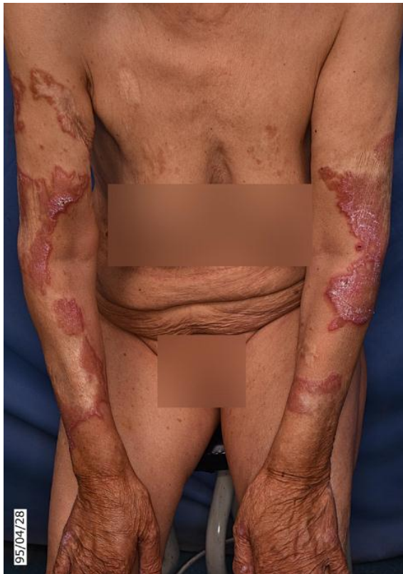
شکل ۱ ب: پلاک‌های انفیلتراتیو و وروکوز در محل اسکارهای سوختگی

بیمار از خارش شدید ضایعات شاکی بود. هیچ یافته‌ی فیزیکی دیگری دیده نشد. هم‌چنین بیمار