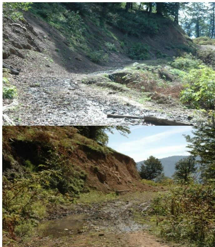
شکل ۲- عکس‌های مورد استفاده برای مطالعه. عکس‌های با کیفیت خوب (بالا) و عکس‌ها با کیفیت بد (پایین).