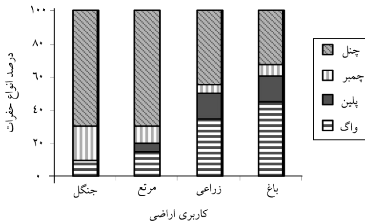
شکل ۳- درصد انواع نوع حفره‌ها در کاربری‌های مختلف.

همان‌طور که در شکل ۳ نیز به خوبی مشهود است درصد حفره‌های واگ و پلین در کاربری‌های تحت خاک‌ورزی بیش‌تر از جنگل و مرتع و همچنین درصد حفره‌های چنل و چمبر در جنگل و مرتع بیش‌تر از کاربری زراعی تحت کشت و باغ می‌باشد. - اندازه حفره‌ها در مقاطع نازک خاک: اندازه حفره‌ها در زیر میکروسکوپ پلاریزان با استفاده از میکرومتر اندازه‌گیری شد (جدول ۲). اندازه حفره‌ها در کاربری جنگل و مرتع بسیار متنوع بوده و از کم‌تر از ۲ میکرومتر تا چند میلی‌متر تغییر کرده است اما در نمونه‌های تحت کشت و کار به‌خصوص در کاربری زراعی حفره‌های درشت بسیار کم بوده و حفره‌های بزرگ‌تر از ۱۰ میکرومتر به‌ندرت یافت می‌شوند. حفره‌های از نوع واگ در کاربری‌های طبیعی بزرگ‌تر از حفره‌های واگ در نمونه‌های تحت خاک‌ورزی هستند در حالی که تعداد واگ‌ها در نمونه‌های تحت خاک‌ورزی بیش‌تر است. در حقیقت در این اراضی وزن ناشی از حضور ماشین‌های کشاورزی موجب فشردگی خاک شده و ذرات خاک را به هم می‌فشارد. در نتیجه حفره‌ها ممکن است در محلهایی با ذرات خاک پر شوند و یا یک حفره درشت به تعدادی حفره ریز تقسیم شود. اجرای عملیات زراعی سبب کاهش اندازه حفره‌ها می‌شود و به‌طور کلی اندازه حفره‌ها در مقاطع جنگل و مرتع، بزرگ‌تر از مقاطع تحت خاک‌ورزی است (واپریو و لال، ۲۰۰۶). در این پژوهش عمده حفره‌ها در مقاطع نازک کاربری‌های زراعی و باغ از نوع واگ‌های ریز است (شکل ۲- د، ه).