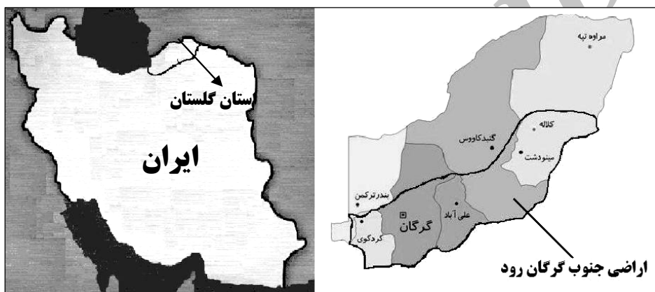
شکل ۱- موقعیت منطقه مورد مطالعه.

اراضی جنوب گرگان‌رود دشتی است به وسعت ۳۳۷۰۰۰ هکتار واقع در استان گلستان که بین طول جغرافیا ۵۳ درجه و ۵۹ دقیقه و ۳۱ ثانیه شرقی و عرض جغرافیایی ۳۶ درجه و ۴۴ دقیقه و ۳۰ ثانیه شمالی قرار دارد. این منطقه از شمال به گرگان‌رود و دیوار اسکندر، از غرب به دریای خزر و از جنوب و شرق به کوه‌های البرز محدود می‌شود. ارتفاع منطقه بین ۲۵-۲۷۰ متر از سطح دریا می‌باشد (شکل ۱).