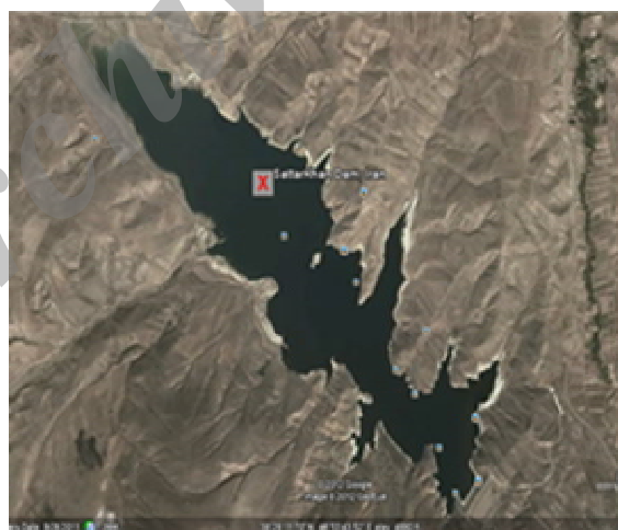
شکل ۲- دریاچه مخزن سد ستارخان.