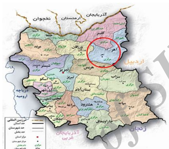
شکل ۱- موقعیت سد ستارخان در استان آذربایجان شرقی - آهر.

در سال ۱۳۷۷ به بهره‌برداری رسیده است و عملیات رسوب‌سنجی آن برای اولین بار در سال ۱۳۸۸ صورت گرفته است (گزارش آب منطقه‌ای، ۲۰۰۹).