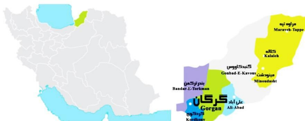
شکل ۱- موقعیت جغرافیایی شهرستان گرگان.

(۱۵). جمع‌بندی مطالعات انجام شده کاربرد نظریه بازی‌ها را در مواردی که اهداف با هم در تضاد است نشان می‌دهد. همچنین در حوزه منابع آبی غالباً از روش برنامه‌ریزی خطی برای به‌دست آوردن هدف اقتصادی یا عایدی کشاورزان استفاده شده است. بر این اساس در مطالعه حاضر به‌منظور تعیین برداشت بهینه منابع آب زیرزمینی از رهیافت تعادل نامتقارن نش استفاده شد. در این مطالعه کشاورزان (بازیکن ۱) به دنبال حداکثر کردن سود اقتصادی و محیط‌زیست (بازیکن ۲) به دنبال حداقل کردن زیان محیط‌زیستی می‌باشند. همچنین حجم کل استخراج از منابع آب زیرزمینی به‌عنوان متغیر تصمیم در نظر گرفته شد.