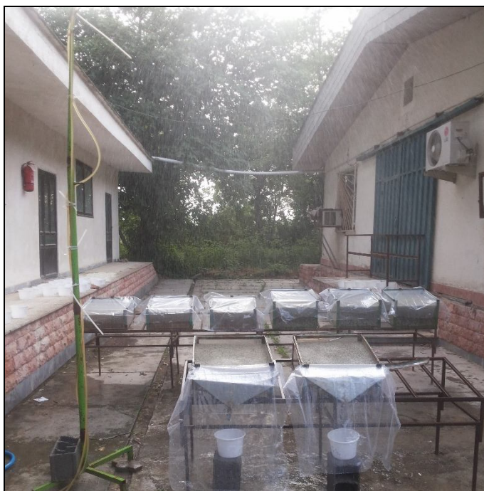
شکل ۱- نمایی از فرآیند شبیه‌سازی باران روی کرت‌های آزمایش.

حین اجرای آزمایش، علاوه بر ثبت زمان شروع رواناب و خاتمه آن پس قطع بارندگی، میزان رواناب و رسوب خروجی از کرت‌ها پس از شروع رواناب هر دو دقیقه یکبار (۳۱) و تا آخر آزمایش اندازه‌گیری شد. هر یک از نمونه‌های برداشترشده در بازه‌های زمانی دو دقیقه‌ای از ابتدای شروع رواناب در اولین کرت دارای رواناب تا انتهای آزمایش، با شماره‌های یک تا ۳۹ (شکل ۲) نام‌گذاری شدند. پس از اتمام فرآیند شبیه‌سازی باران، حجم رواناب در بازه‌های زمانی دو دقیقه و هم‌چنین کل بازه زمانی پس از شروع رواناب تا خاتمه بارندگی (۳۴) بر حسب میلی‌لیتر اندازه‌گیری شد. به‌منظور اندازه‌گیری میزان هدررفت خاک و غلظت رسوب در هر یک از تیمارها نیز از روش برجای‌گذاری و توزین رسوب باقی‌مانده به‌ترتیب بر حسب گرم و گرم بر لیتر پس از خشک کردن در آون با دمای ۱۰۵ درجه‌ی سانتی‌گراد به‌مدت ۲۴ ساعت استفاده شد (۳۵).