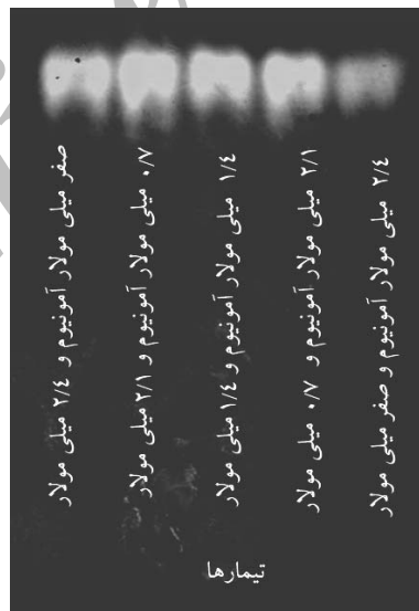
شکل ۳- الگوی الکتروفورزی آنزیم کاتالاز بر روی ژل پلی اکریل آمید در تیمارهای مختلف نیتروژن.