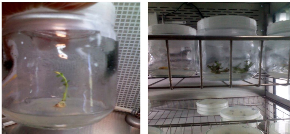
شکل ۳- A. تولید شاخساره از کالوس گره در تیمار دوم (PGR 2) a و تیمار چهارم (PGR 4) a. کشت شاخساره های تولیدی در تیمار اول (PGR 1) b برای ریشه دهی.