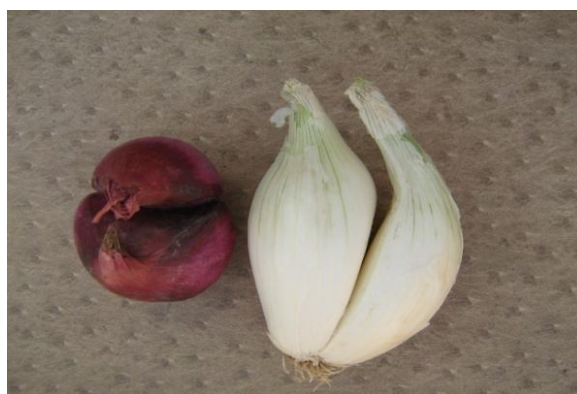
شکل ۲- سوخ دوقلو.