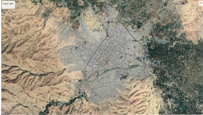
تصویر شماره (۱): تصویر ماهواره‌ای از شهر ارومیه