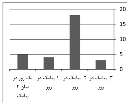
نمودار ۱ اکثر دانش‌آموزان با ارسال دو پیامک آموزشی در روز موافق بودند

در نمودار (۱) نظر دانش‌آموزان گروه دوم این پژوهش در مورد تعداد مناسب ارسال پیامک در هر روز نمایش داده شده است. بیشتر دانش‌آموزان با ارسال دو پیامک در روز موافق بودند.