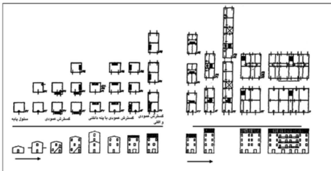
شکل ۳ ترسیم رشد گونه از ساده به تکامل یافته، از خانه ردیفی تا خانه خطی. (از چپ به راست) خط افقی گسترش زمانی و خط عمودی گسترش عمودی و تکاملی بنا را نشان می‌دهد [۲۵].

۲- انتخاب و بازشناسی گونه پایه (گونه پایه واحدی است که از آن گونه‌های کامل‌تر آغاز می‌شود): (یک اتاق یا یک خانه مسکونی) با استفاده از شواهد باستان شناسی و بازسازی تصویری. ۳- بررسی روند رشد کالبدی گونه پایه و عوامل مؤثر در این رشد: این رشد تابع قوانین کمی همانند دو برابر شدن