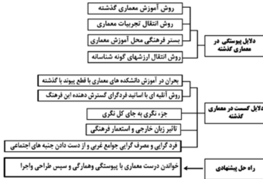
شکل شماره ۱ ریشه‌های بحران معماری در حوزه‌های آموزشی، پژوهشی و اجرایی و راه حل آن

در این میان موراتوری‌ها با اهمیت قائل شدن برای این موضوع، پس از بیان اینکه محصولات معماری گذشته دارای ارزش‌های گونه شناسانه بوده‌اند، در پاسخ به چگونگی بروز این ارزش‌ها و در پاسخ به رابطه ذهن و عین و ارتباط آن با معماری از اندیشه‌های «کروچه» بهره می‌گیرند. از نگاه آنها، انسان به وسیله ساختار ذهن خود، واقعیت‌های بیرون را به درون ذهنش انعکاس می‌دهد. او آنچه از طبیعت می‌بیند در ذهنش تبدیل به ساختاری عددی کرده و بر اساس همین ساختار اقدام به عمل می‌کند. ذهن انسان همه چیز را در طبیعت می‌بیند و فرا می‌گیرد و هیچ چیز را خود خلق نمی‌نماید [۲۴].