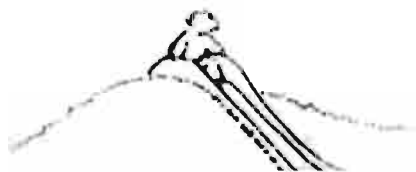
شکل ۴ استفاده از شیب زمین در طراحی زمین بازی