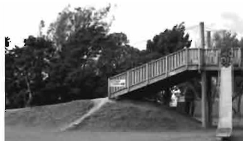
شکل ۱ استفاده از عناصر طبیعی مانند شیب زمین در طراحی زمین بازی