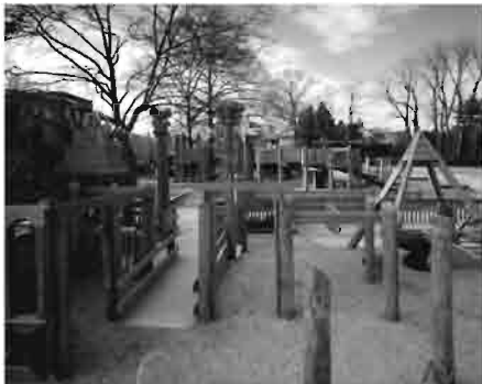
شکل ۲ استفاده از عناصر موجود در طبیعت همچون چوب در ساخت وسایل بازی

بخش‌های اصلی زمین‌های بازی طبیعی برای کودکان به همراه بیان نمونه‌هایی از چگونگی استفاده آنها در جدول ۴ بیان شده است: