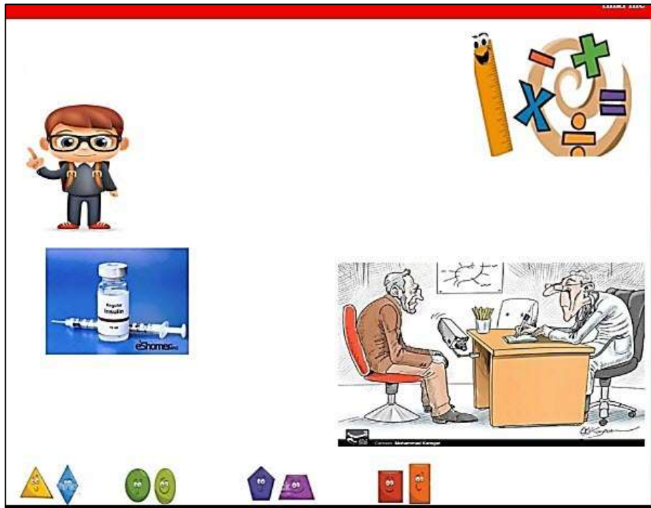
شکل ۲: نمایی از محتوایی الکترونیکی مبتنی بر طنز Fig. 2: A screen shot of humorous e-content