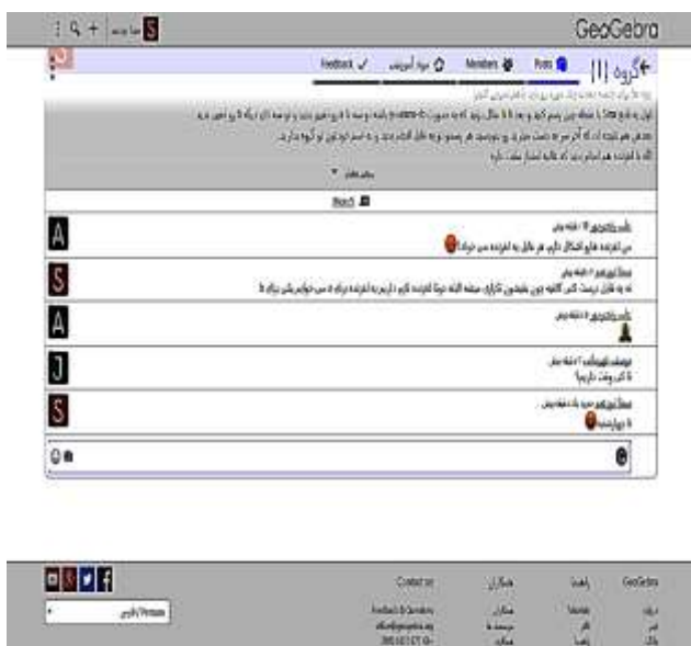
شکل ۳: تصویری از فضای همیارانه نرم‌افزار