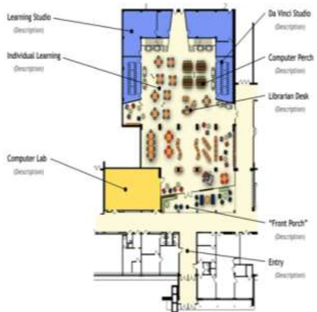
شکل ۱: انعطاف‌پذیری فضاهای بزرگ در مدارس Fig. 1: Flexibility of large spaces in school

فضاهای بزرگ امکان جمع‌شدن افراد را فراهم می‌نماید. میزان بزرگی این فضاها با نوع تجهیزات به کار گرفته‌شده در فضا متناسب است. فضاهای بزرگ مناسب کارهای گروهی، عملیاتی (اجرایی) و ورزشی می‌باشد [۲۴].