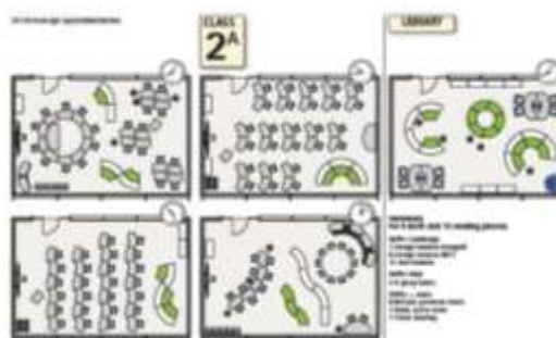
جدول ۲: انعطاف‌پذیری و ضابطه‌های ایجاد آن در مدارس

For example, in the first and second hours of a regular lesson, mixed instruction in small groups of 2 to 9 and a third time is required to work in larger groups. In small schools, there is enough room for group activities, and then preparing flexibility for all three modes.