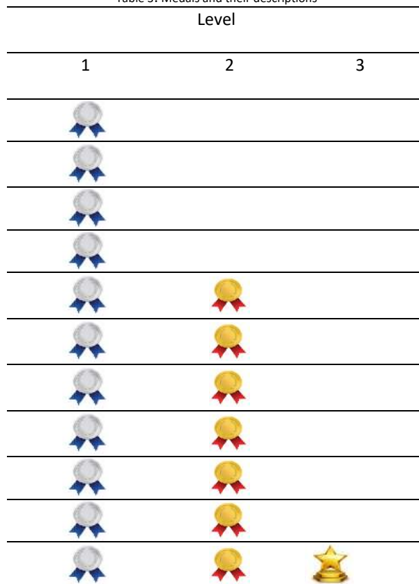
Table 3: Medals and their descriptions