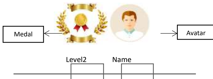
جدول ۴: تابلو ثبت