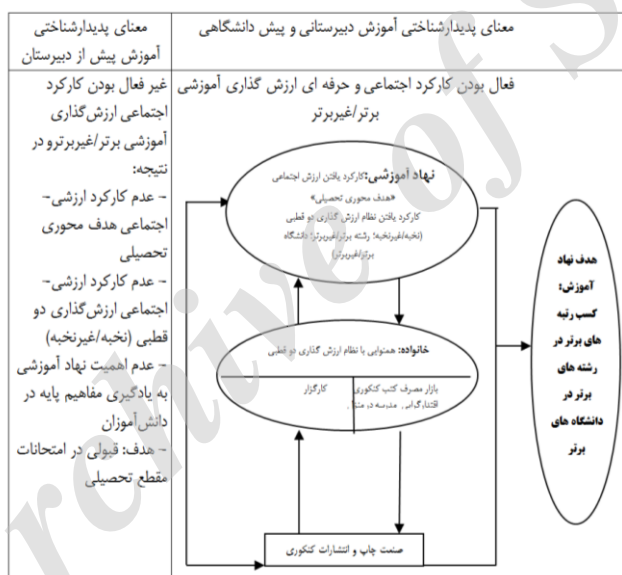
نمودار شماره (۱) فرایند اصلی اجتماعی ظهور یافته

الف) فرایند اصلی اجتماعی، اشاره کننده به نوعی گستردگی هنجاری ارزش‌گذاری دو قطبی «نخبه/ غیرنخبه»؛ «رشته برتر/ غیربرتر»؛ و «دانشگاه برتر/ غیربرتر» است که در دیدگاه‌های دانش‌آموزان مصاحبه شونده مشاهده شد، اگرچه آن‌ها قادر به تبیین دقیق چرایی و چگونگی این گستردگی ارزش‌گذاری دو قطبی در جامعه نبودند ولی همگی به هنجارمندی و کارکرد داشتن آن در نظر عامه مردم به قطعیت واقف بودند.