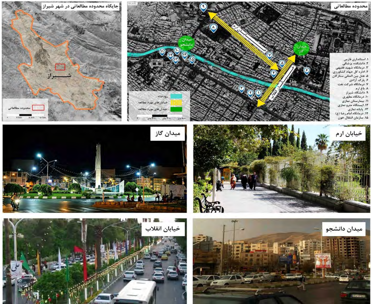
شکل ۲- موقعیت مکانی فضاهای عمومی شهری منتخب در شهر شیراز

مستقیم دارند و در کمتر فضای عمومی دیگری در شهر شیراز (مانند فضاهای موجود در بافت تاریخی مانند محدوده ارگ و