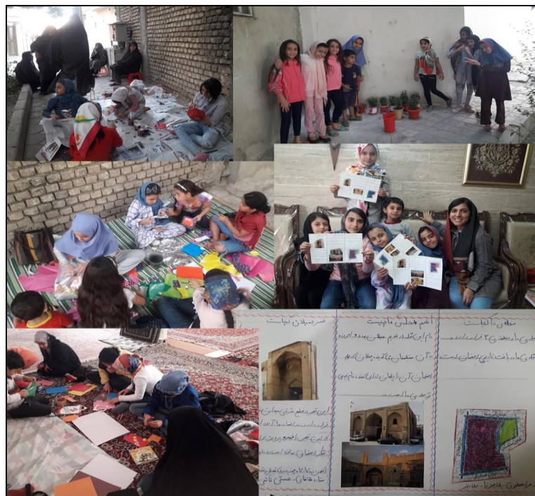
شکل ۲- کودکان در حال انجام فعالیت‌های مشارکتی

جالب توجهی درباره فرزندانشان دارند. این تعامل از ابتدای سال ۱۳۹۸ تا زمان نوشتن مقاله در جریان است. در ادامه فرایند پژوهش، ۸ فعالیت مشارکتی مرتبط با فضای سبز ذکر شده طراحی شد. طراحی این فعالیت‌ها با توجه به اولویت‌های کودکان درباره این فضای سبز انجام شد؛ درواقع، پژوهشگر از کودکان خواست فضای سبز دلخواهشان را نقاشی کنند یا درباره آن مطلب بنویسند و متناسب با توان کودک در برآورده‌سازی آنچه در ذهن دارد، این فعالیت‌ها درباره فضای سبز ذکر شده و استفاده در آن طراحی شدند. این فعالیت‌ها عبارت‌اند از: رنگ‌آمیزی گلدان‌های گل سفالی، گلکاری در گلدان‌های سفالی رنگ‌شده، کاربردی کردن گلدان‌های پلاستیکی دورریختنی، تهیه روزنامه دیواری معرفی محله، تهیه روزنامه دیواری اریگامی حیوانات، تهیه روزنامه دیواری اریگامی گیاهان، تهیه روزنامه دیواری بازیافت، تهیه نامه به شهردار منطقه ۳ درباره ایجاد تغییر در فضای سبز. در طراحی این ۸ فعالیت ۵ معیار در نظر گرفته شد: برای کودکان انجام‌شدنی باشد، جدید و جذاب باشد، خطرناک