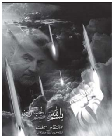
تصویر ۲: مفهوم انتقام سخت در پوستر سردار سلیمانی.

تئوری‌های شناخته‌شده مفاهیم نمادین رنگ و نیز روان‌شناسی رنگ در نظریه لوشر، ۱ رنگ قرمز را محرک اراده برای پیروزی و اشکالی از نیروی زندگی، قدرت و توانایی بیان می‌کند. از نظر لوشر رنگ قرمز رویارویی با اراده یا قدرت اراده را بیان می‌کند و از نظر سمبلیک مانند خونی است که به هنگام فتح پیروزی ریخته می‌شود. (لوشر، ۱۳۷۰: ۸۴) (تصویر ۱)