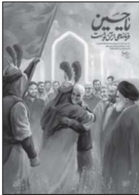
تصویر ۱۲: پیوستن شهید سلیمانی به ارواح طیبه شهدا

است (تصویر ۱۱) که عبارت است از حذف جزئیات تا حد مبانی ضروری است. (استینسون، ۱۳۹۰: ۹۹)