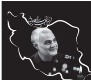
تصویر ۱۴: القای مفهوم اندوه مردم ایران از طریق استعاره تصویری. (نهضت مردمی پوستر انقلاب، ۱۳۹۸/۱۰/۱۷)

ناگفته پیداست که با شهادت سردار سلیمانی اندوه از دست دادن قهرمان مبارز پیروزمند بر قلب‌های مردم ایران جاری شد، هرچند شهادت آرزوی سردار بود؛ اما غم جدایی از سردار عزیز، بخشی از تاریخ شفاهی ملت ایران خواهد بود. نکته‌ای که امام خامنه‌ای به خوبی به آن اشاره کرده‌اند. عبارت «ایران شود عزادار تو ای سردار مملکت» در برخی پوسترها نیز همین مفهوم را بیان می‌دارد.