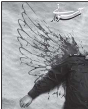
تصویر ۱۱: ایجاز تصویری و القای مفهوم شهادت (نهضت مردمی پوستر انقلاب، ۱۳۹۸/۱۰/۱۷)

۱-۳-۷. ویژگی‌های شخصیتی عطوفت و مهربانی در کنار سایر ویژگی‌های شخصیتی ایشان، مانند: ولایت‌مداری، اقتدار، ایمان و جهاد از مشخصه‌های شخصیتی