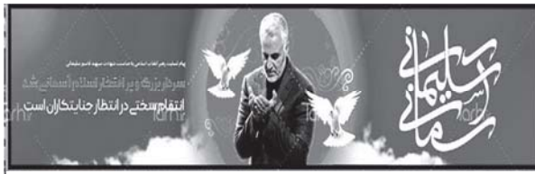
تصویر ۱۰: ویژگی‌های شخصیتی سردار سلیمانی، نیایش و عبادت، کاربرد نمادهای نور، کبوتر (طرح دات آی آر، ۱۳۹۸/۱۰/۱۸)

۱-۳-۷. ویژگی‌های شخصیتی عطوفت و مهربانی در کنار سایر ویژگی‌های شخصیتی ایشان، مانند: ولایت‌مداری، اقتدار، ایمان و جهاد از مشخصه‌های شخصیتی