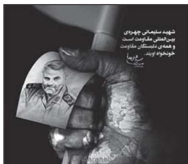
تصویر ۴: مفهوم ایستادگی و مقام، مفهوم استعاری نشانه‌های دست و پرچم قرمز. (خبرگزاری اس.ان.ان، ۱۴/۱۰/۱۳۹۸)

گفتنی است ایستادگی در برابر ظلم و مقاومت بخشی از فرهنگ ایران و اسلام است که مرجع ظهور