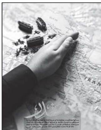
تصویر ۷: قدرت و اقتدار و امنیت معنای اصلی نشانه‌های پوستر نشانه‌ها از طریق استعاره مفاهیم را بیان می‌کند. (نهضت مردمی پوستر انقلاب، ۱۳۹۸/۱۰/۱۷)

باید توجه داشت که در میانه «لا» قطره خون شهیدی قرار گرفته است که نشانه ارجاع مستقیم به شهادت و مبارزه دارد. مهم‌ترین عناصر معنایی این پوستر نوشتارهای قرآنی آن است که زنده بودن شهید، نترسیدن مؤمنان و نیز محزون نشدن آنها از شنیدن خبر شهادت را بیان می‌دارد.