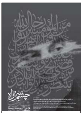
تصویر ۱۳: وفای به عهد و شهادت در راه خدا مفهوم پوستر. (خبرگزاری آنا، ۱۳۹۸/۱۰/۱۷)

یکی از ویژگی‌های شهید سردار سلیمانی، شوق و اشتیاق برای شهادت و پیوستن به ارواح شهدا بود. موضوعی که جمله اول پیام امام خامنه‌ای درباره ایشان است: «دیشب ارواح طیبه شهیدان، روح مطهر قاسم سلیمانی را در آغوش گرفتند.» پوستر شماره ۱۲، سردار سلیمانی را در میان حلقه‌ای شادمان از شهیدان و رستگاران راه خدا نشان می‌دهد که در پلان اول تصویر و در صدر حلقه، امام حسین علیه السلام ، حضرت ابوالفضل علیه السلام و امام راحل علیه السلام قرار گرفته است.