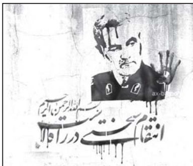
تصویر ۱: مفهوم انتقام در پوستر سردار سلیمانی

با رفتن سردار شهید قاسم سلیمانی ... انتقام سختی در انتظار جنایتکارانی است که دست پلید خود را به خون او آلودند. (پایگاه اطلاع‌رسانی دفتر مقام معظم رهبری، ۱۳/ ۱۰/ ۹۸)