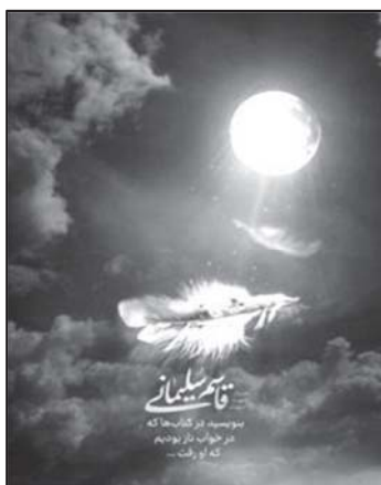
تصویر ۹: تداعی حس امنیت از طریق نشانه‌های استعاری.

برخی از پوسترها حس امنیت و آسایش مردم را در سایه اقتدار سردار سلیمانی بیان می‌دارند و اندوه