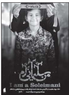
تصویر ۱۶: القای مفهوم تداوم راه قاسم سلیمانی از طریق تصویر و نوشتار (نهضت مردمی پوستر انقلاب، ۱۳۹۸/۱۰/۱۷)

یکی از عمیق‌ترین معانی پوسترها و بیلборدهای حاج قاسم سلیمانی، تداوم راه اوست. پیام‌هایی همچون «حاج قاسم زنده است، من سلیمانی‌ام، سلیمانی‌ها در راهند» در این پوسترها به چشم می‌خورد. پوسترها این پیام رهبری را به مخاطب منتقل می‌کنند که خط جهاد مقاومت با انگیزه مضاعف ادامه خواهد یافت.