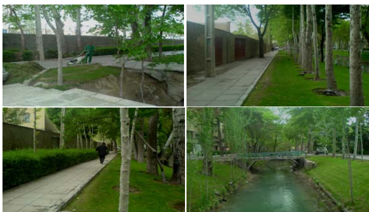
تصویر ۸- نمونه هایی از طرح اجرا شده در حاشیه مادی نیاصرم