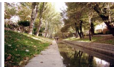
تصویر ۱- تصاویری از مادی نیاصرم؛ زیباترین و پرآب‌ترین مادی شهر اصفهان