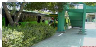
تصویر ۹- پاره ای از اقدامات صورت گرفته در چشمه باقرخان: نصب تابلو، استقرار ایستگاه اتوبوس، اصلاح شیب جانبی