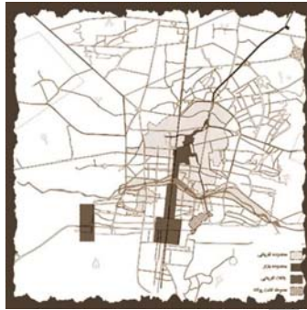
تصویر ۵- تأثیر زاینده رود و انشعابات آن بر بافت شهر اصفهان

اغلب مادی‌ها با عبور از بافت تاریخی شهر اصفهان ضمن تأثیری که بر بافت و محدوده اطراف خود گذاشته‌اند، از ویژگی‌های کالبدی، تاریخی و اجتماعی محل عبور خود تأثیر پذیرفته‌اند. به طوری که یک مادی با گذر از محله‌های مختلف که ویژگی‌های اجتماعی و فرهنگی متفاوتی داشته در هر قسمت رنگ و طرح ویژه‌ای را در بدنه خود نمایان ساخته است (تصویر شماره ۵).