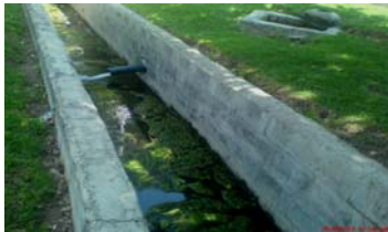
تصویر ۷- مواردی از نابسامانی مادی‌ها: ناخوانایی تابلو شناسنامه مادی‌ها تخلیه پساب‌ها و ریختن زباله تبدیل شدن مادی به محور ترافیک شهری عدم هرس به موقع درختان

- آنچه از مسائل مادی‌ها به سازمان آب منطقه‌ای مربوط می‌شود، موضوع اختلافات مالی بین این سازمان و شهرداری در مورد پرداخت آب بهاء می‌باشد. این سازمان متولی جریان آب و توزیع آن در منطقه دشت اصفهان است و در هنگام بروز این اختلافات و متعاقب آن قطع جریان آب، مسیر مادی به وضع اسف‌باری دچار می‌شود و مشکلات و فشارهای مردمی را برمی‌انگیزد (تصویر شماره ۷).