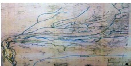
تصویر ۳- نحوه حرکت مادی‌ها در شهر؛ مادی‌ها چون شریان‌های حیات بخش در سطح شهر اصفهان پراکنده شده‌اند.