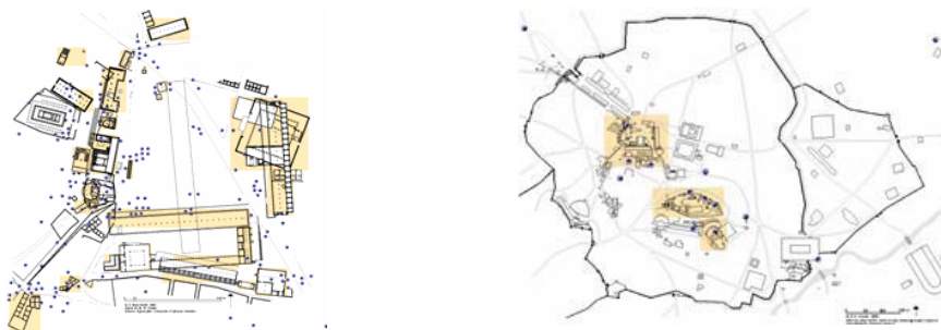
تصویر شماره ۱- نقشه آتن و آگورای آن در قرن پنجم قبل از میلاد (Neelsmith, 1989)