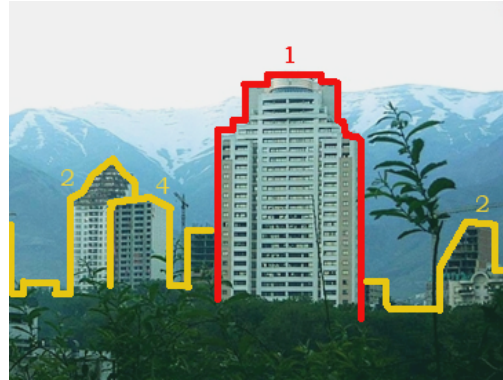
شکل ۲- بافت شهری شمال تهران