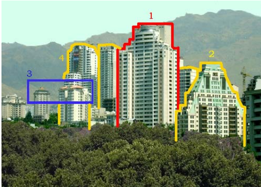
شکل ۳- بافت شهری شمال تهران