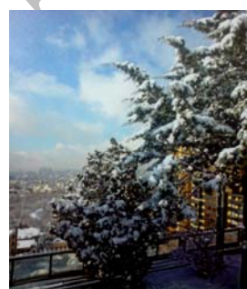
شکل ۱- بام سبز ساخته شده در یکی از مناطق شمال تهران