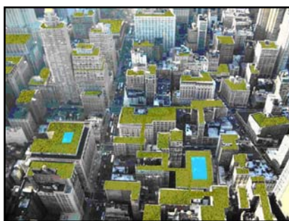
شکل ۲- سامانه بام سبز موضوعی است که در ایران ناشناخته مانده است که در صورت گسترش، مزایای بسیاری با خود همراه خواهد داشت.

امروزه متناسب نمودن کمیت و کیفیت معماری به نخستین دغدغه معماران تبدیل شده است و در رویکرد زیست محیطی با عنوان‌هایی مانند «معماری پایدار» ۱ و «معماری سبز» ۲ بررسی می‌شود. درحالی که پیش از این تنها مؤسسات آموزشی و آژانس‌های دولتی بر ساخت ساختمان‌هایی مطابق با اولویت‌های زیست‌محیطی تأکید داشتند؛ هم‌اکنون مشاغل خصوصی هم هوادار ساخت چنین ساختمان‌هایی شده‌اند. در کشور کانادا و در سال ۲۰۰۰ تعداد ۴۵ ساختمان با مجموع زیربنای ۳ میلیون متر مربع به عضویت نظام راهبری انرژی و طراحی محیط ۳ که توسط شورای ساخت سبز ۴ راه‌اندازی شده بود درآمدند. این تعداد در حال حاضر به ۱۷۱ ساختمان تجاری رسیده است و ۱۸۰۰ ساختمان دیگر نیز برای این امر درخواست جواز نموده‌اند. حدود ۳۰۰۰ مهندس کانادایی دارای مجوز نظام راهبری انرژی و طراحی محیط هستند (Kanter, 2005, 47). در این تحقیق به ارائه معیارهای توسعه سامانه بام سبز در ایران خواهیم پرداخت. نگارندگان بر این موضوع تأکید دارند که در کشور ما بام سبز قبلاً ساخته شده است (شکل ۱) اما سامانه بام سبز موضوع کاملاً متفاوتی است که علی‌رغم توجه بسیاری از کشورهای توسعه یافته و حتی در حال توسعه به آن در کشور ما نه تنها غریب و ناآشنا می‌نماید بلکه تحقیقی در راستای توجیه پذیر نمودن آن صورت نگرفته است. (شکل ۲)