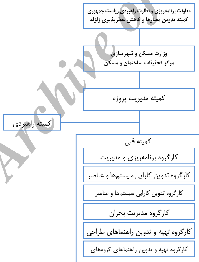
مأخذ: موسوی، ۱۳۸۷، ۲۴۴