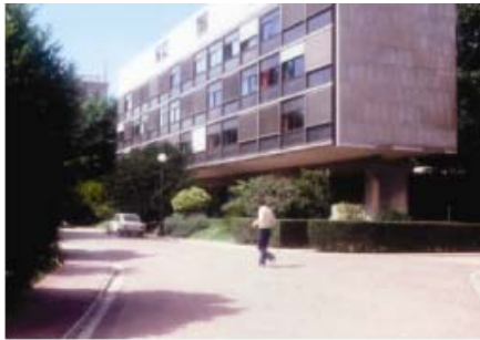
شکل ۱- نمونه سویس در نمایشگاه بین‌المللی پاریس، ۱۹۳۰، لوکوربوزیه قرارگیری ساختمان بر روی پیلوت، بهره‌گیری از پلان آزاد و نماهای شیشه‌ای

پیکربندی‌های نامنظم را با بهره‌گیری از تکنولوژی در اواخر قرن نوزدهم فراهم آورد. دید تاریخ‌گرایانه حاکم بر قرن نوزدهم که ساختمان‌ها را به سوی بهره‌گیری از پیکربندی‌های منظم سوق می‌داد در اوایل قرن بیستم از سوی تعدادی از معماران پیشرو به ویژه در اروپا مورد حمله قرار گرفت؛ معمارانی که اعتقاد به دمیدن روح زمان و تکنولوژی عصر خود در کالبد معماری داشتند. بعدها این جنبش به سبک بین‌المللی معروف شد. نمونه بارز این سبک غرفه سویس در نمایشگاه ۱۹۳۰ پاریس است.