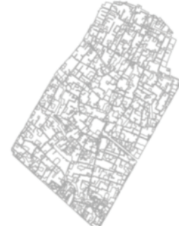
شکل ۳. ناحیه فهادان