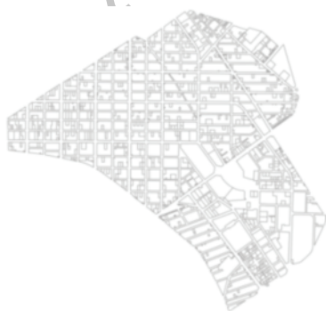
شکل ۸. ناحیه صفائیه (مأخذ نقشه پایه: مهندسین مشاور عرصه، ۱۳۸۶)