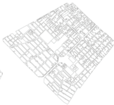
شکل ۷. ناحیه آزادشهر