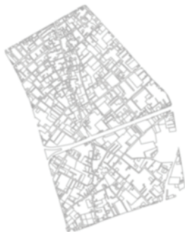
شکل ۵. ناحیه سر دو راه.

در ادامه، روش تحلیل رگرسیونی چند متغیره در نواحی ذکر شده (بر اساس نمونه های برداشت شده از هر محله) اعمال شد. بر اساس این تحلیل، نسبت تراکم ساختمانی از ۰/۴۳ تا ۰/۸۵ در این نواحی متفاوت بوده است. کمترین تراکم ساختمانی مربوط به ناحیه سردو راه (۰/۳۳) و بیشترین تراکم ساختمانی مربوط به ناحیه صفائیه بوده (۰/۸۵) که این تراکم ناشی از اجرای طرح های انبوه سازی و آپارتمان سازی اخیر در این ناحیه از شهر یزد بوده است. این ناحیه در عین حال، کوتاه ترین قدمت سکونت نسبت به سایر نواحی ذکر شده در بالا را دارد. سایر تراکم ساختمانی نواحی عنوان شده در بالا عبارتند