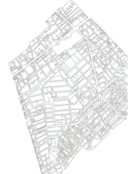
شکل ۶. ناحیه مسکن و شهرسازی