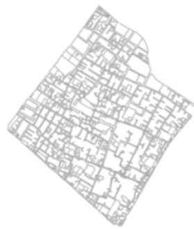
شکل ۴. ناحیه شیخداد.