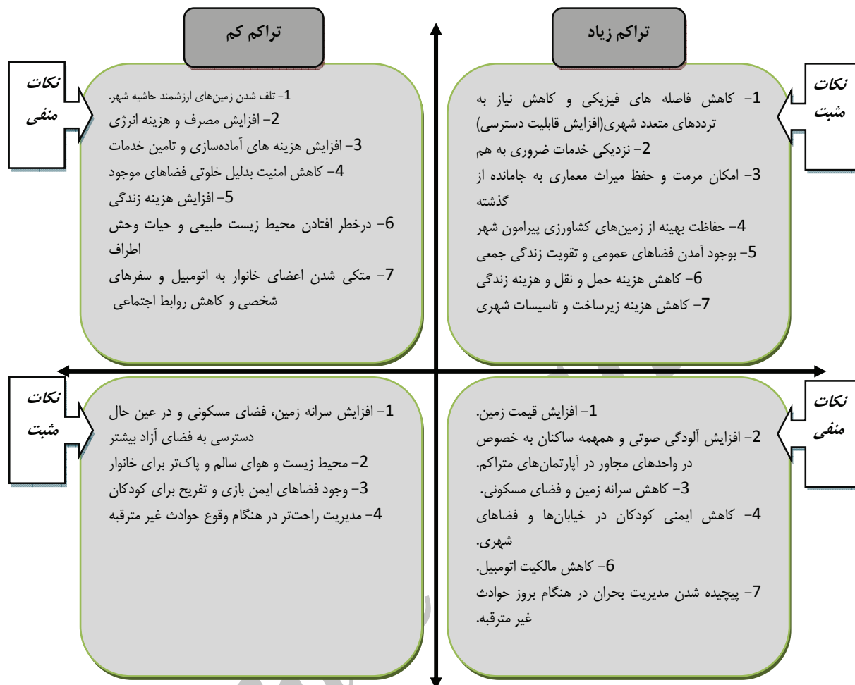
شکل ۱. نکات مثبت و منفی تراکم کم و زیاد (مأخذ: عزیز، ۱۳۸۲، ۵۳-۴۰؛ با تغییر و تلخیص).

و "مک-دونالد" نیز پنج عنصر اصلی تاثیرگذار بر ترکیب فرم شهری را بیان می‌کنند: کاربری زمین، تراکم، زیرساخت‌های حمل و نقلی و موقعیتی، ویژگی‌های محیط ساخته شده و طرح بندی بلوک‌های شهری. (Jones et al., 2004)