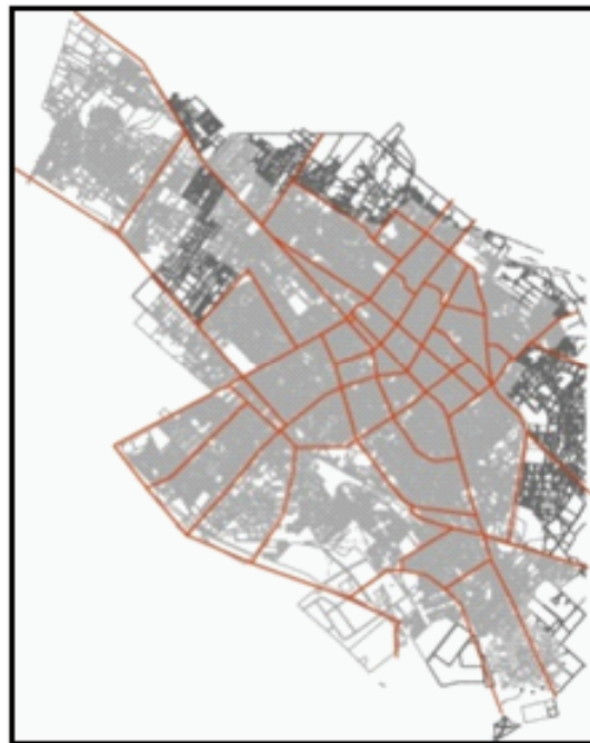
شکل ۹. تغییرات مساحت بلوک های شهری از مرکز به حاشیه شهر یزد؛ همان طور که پیداست، مساحت بلوک ها اغلب از مرکز به حاشیه شهر افزایش یافته است (مأخذ نقشه پایه: مهندسين مشاور عرصه، ۱۳۸۶).

از آنجا که سیاست های توسعه پایدار شهری امروزه در اکثر شهرهای جهان، به سمت تمرکز بیشتر مناطق مسکونی و فعالیتی در نواحی مرکزی و حفظ زمین ها و محیط زیست ارزشمند پیرامون شهرها