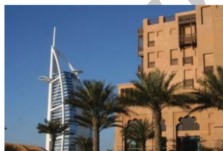
شکل ۲۵. دبي - جميره ، نماي هتل ميناالسلام