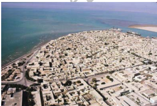
شکل ۲. خلیج فارس و تجارت نقش مهمی در بوجود آمدن بافت زیبای بوشهر داشته است

بوشهر با بافت بندری ویژه در جنوب ایران و مرکز خلیج فارس، از ارزش جهانی برخوردار است و این ارزش تاریخی - فرهنگی وابسته به معماری بومی و طبیعت گرایانه شهرسازی و معماری این بافت شهری است که آن را در مقام یک اثر هنری قرار داده است. بنابراین شناخت بافت بوشهر، جهت تقویت هویت بومی منطقه و کاربری های فرهنگی و تفریحی و ابقای گونه های با هویت موجود امری ضروری است. در این راستا نخست نقش تاریخی خلیج فارس در بوجود آمدن شهرهای کرانه ای و سپس به عوامل تأثیرگذار در شکل گیری معماری بافت قدیم بوشهر و نقش مکتب اصفهان در معماری بافت پرداخته شده است و در ادامه ارزش های معماری بافت قدیم بوشهر و تأثیر آن بر معماری کشورهای حاشیه خلیج فارس به ویژه محله البستکیه در پرداخته شده است.