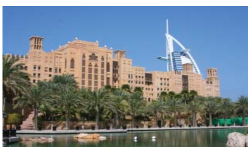
شکل ۲۶. دبي - جميره ، نماي هتل ميناالسلام و برج العرب. سنت ومدرن