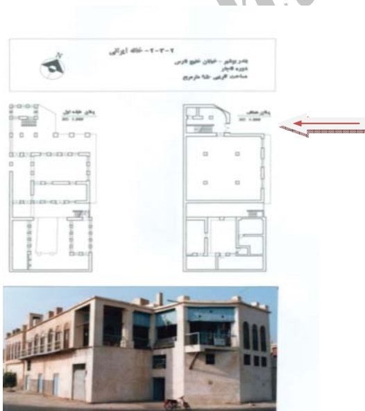
شکل ۱۴. ورودی اصلی بنا، بافت قدیم بوشهر، محله بهبهانی - خانه ایرانی، مأخذ دفتر فنی دانشکده معماری و شهرسازی دانشگاه ش.بهشتی ۱۵

غالب بناهای بافت از دو جبهه باز هستند. با توجه به شرجی بودن منطقه و رطوبت هوا، هدایت باد مطلوب از خارج به داخل ساختمان بسیار حیاتی است و این موضوع وجود پنجره ها و بازشوها در نمای بیرونی را اجتناب نا پذیر می نماید. بازشوها باد مطلوب را به فضاهای درونی سوق داده واز آنجا به درون اتاق ها هدایت می کنند. اتاق های