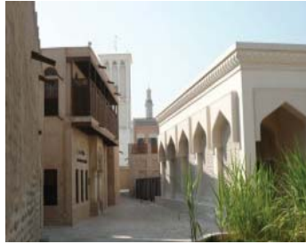
شکل ۲۹. دبی، جمیره، نمای هتل، استفاده از عناصر معماری بافت قدیم (شناشیر) تراس چوبی در نمای هتل میناالسلام