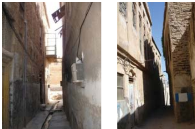
شکل ۸- کوچه در بافت قدیم بوشهر- محله کوتی

ساختار کالبدی بافت قدیم بوشهر طی زمان و با گسترش شهر شکل گرفته است. فضاها و عناصر شهری هر کدام در جای مناسب خویش استقرار یافته و یا ایجاد شده است. بافت کالبدی شهر بوشهر و مناسبات