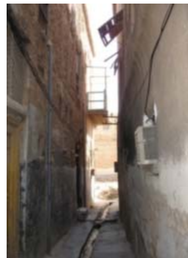
شکل ۳. شرایط اقلیمی در شکل‌گیری کانون‌های زیستی نقش اساسی دارند. کوچه در محله کوتی بوشهر