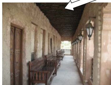
شکل ۲۳. پوشش سقف اتاقها از چوب «چندل» و حصير. محله بستکيه - دبي