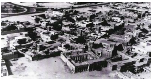
شکل ۲۴. بافت متراکم محله بستکيه در دبي و باد گيرهايي که توسط مهاجرين ايراني ساخته شده است