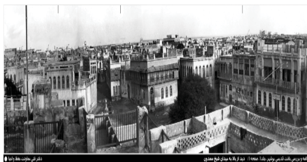
شکل ۱۰. بافت بوشهر از بلوک های کوچک تک خانه ای سازمان یافته مأخذ: میراث فرهنگی بوشهر. دفتر فنی معاونت حفظ و احیا ۱۳

بافت قدیم مانند سایر شهرهای جنوبی کشور از بلوک های کوچک تک خانه ای ساخته شده است. این روش کمک می کند جریان هوا از کوچه های باریک بگذرد و نسیم خنکی برای عابر پیاده به ارمغان آورد.