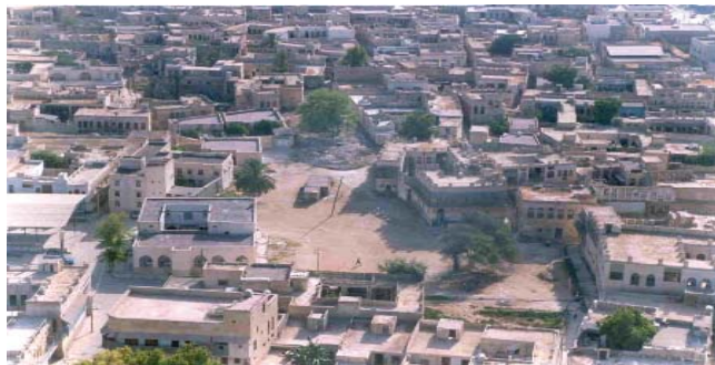
شکل ۹. ارتباط خانه ها و مراکز محله. بافت قدیم بوشهر. محله کوتی مأخذ: م.م. جبارنیا، ۱۳۷۹ ۱۲

حد فاصل بلوک ها کوچه های باریک است که مرتباً با یکدیگر ارتباط پیدا می کنند. کوچه های باریک و تنگ در نهایت به فضای گشادتری به نام میدانچه ختم می شوند. این فضای باز را می توان مهم ترین عنصر در سازماندهی فضای شهری و بافت نامید (شکل ۱۰).