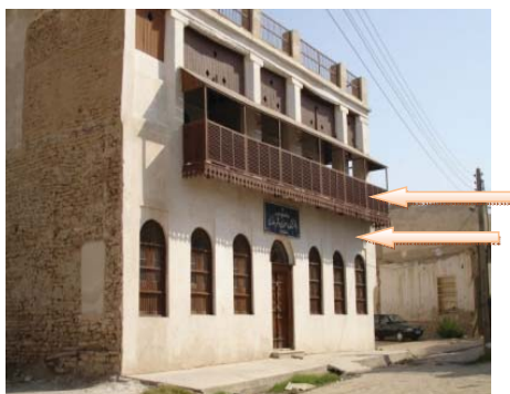
شکل ۱۶. بازشوها در جداره بیرونی، شناشیر، سایبان، بافت قدیم بوشهر. محله کوتی