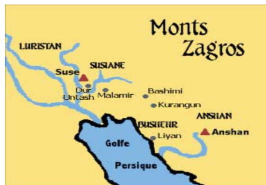
شکل ۱. خلیج فارس و شهر باستانی لیان «بوشهر امروزی» در دوره ایلامیان