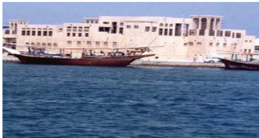
شکل ۲۲. جزر ها و فرورفتگی ها در نمای بنا منطقه شندغه. خانه شیخ سعید آل مکتوم - دبی - سال ساخت ۱۸۹۶