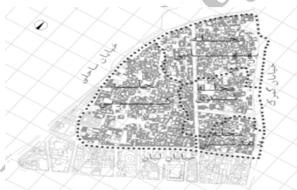
شکل ۵. چهار محله بافت قدیمی بوشهر ۸

سیمای عمومی بافت قدیم بوشهر، واجد انسجام و یکپارچگی خاصی است. بناهای مختلف در این محدوده، با وجود تفاوت هایی که با