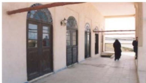
شکل ۱۷. هدایت باد توسط ایوانها. بافت قدیم بوشهر - محله بهبهانی