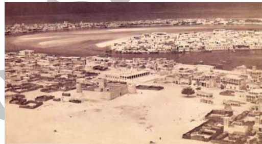
شکل ۲۱. دبی قبل از تحولات سال ۱۹۵۰

است. برای تهویه خانه ها از بادگیرها که عنصر برجسته معماری ایرانی است استفاده شده است. کوچه های تنگ و باریک میان بناهای ساخته شده فاصله انداخته و با توجه به ارتفاع بلند آنها کوچه های باریک از نعمت سایه نیز برخوردارند (شکل ۱۹ و ۲۰).