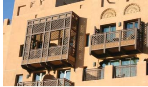
شکل ۳۰. دبی، محله بازسازی شده بستیکه

گردشگری و جذب توریست محله قدیمی البستیکه را بازسازی نمودند. با این هدف و در پی یافتن هویتی معمارانه تلاش نمودند در طراحی و ساخت بناهای جدید در دبی از عناصر و معماری گذشته کشور ما استفاده نمایند. نشانه هائی از تأثیر فرهنگ و عناصر معماری ایرانی (بادگیرها و بسیاری عناصر دیگر که به آن ها اشاره شد) در طراحی و ساخت این بناها دیده می شود. هتل میناالسلام در دبی نمونه ای بارز و دیدنی از این نوع معماری است.