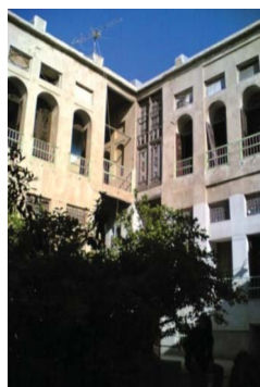
شکل ۱۵. بازشوها در جداره داخلی. بافت قدیم بوشهر. محله کوتی. خانه دهدشتی

قرار می دهد» می باشد. در خانه های بافت قدیم بوشهر تمامی فضاهای داخلی کم عرض و یک لایه بوده و دارای پنجره های رو به روی هم می باشند. بنابراین تهویه در فضاهای بسته داخلی به خوبی امکان پذیر بوده و شرایط مناسبی در داخل برقرار است. وجود تارمه ها و ایوان های وسیع در به داخل کشاندن باد مطلوب و ایجاد تهویه داخلی سهم مؤثری دارند. وجود حیاط ها امکان نورگیری را به فضاهای درونی میسر می سازد. در نهایت کرکره های چوبی نقش به سزایی در جلوگیری از تابش شدید آفتاب و پالایش آن را دارند (شکل ۱۷ و ۱۸).