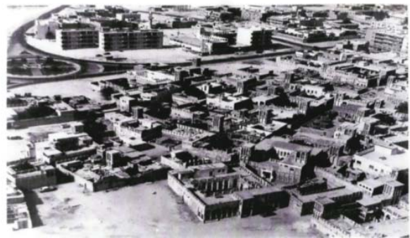
شکل ۱۹. محله البستکیه دبی