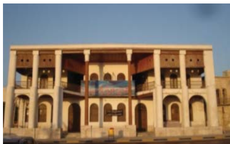
شکل ۱۸. پنجره های بزرگ خارجی با بازشوهایی در قسمت فوقانی برای تهویه فضاها. بافت قدیم بوشهر. محله کوتی - ساختمان امیریه

با توجه به شرایط اقلیمی حاکم بر منطقه و دریا، باد یکی از عوامل مؤثر منطقه است و در تعیین موقعیت عناصر شهری و جهت گیری مناسب مسکن نقش به سزایی دارد. بنا بر این جهت گیری تمام خانه های این منطقه به سمت باد غالب « بادی که از شمال غرب و در جلگه های دجله و فرات در حرکت بوده و سواحل خلیج فارس را تحت تأثیر خود