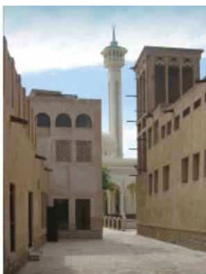
شکل ۲۸. دبي ، محله بازسازي شده بستکيه