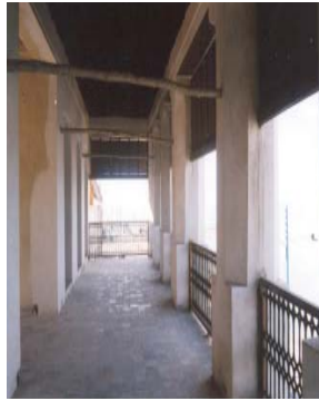
شکل ۱۲. شکل مسیر حرکتی در طبقات