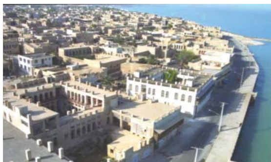
شکل ۶. سیمای بافت از سمت دریا نمایانگر یکپارچگی در تراکم و تعداد طبقات است ۹