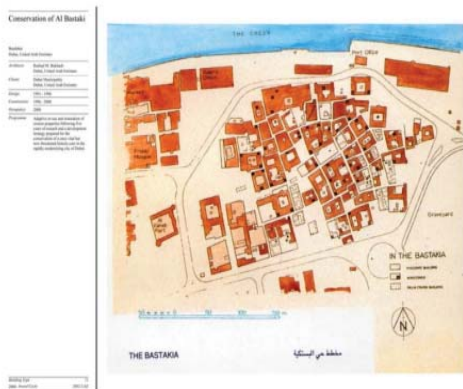
شکل ۲۰. بافت محله بستکیه