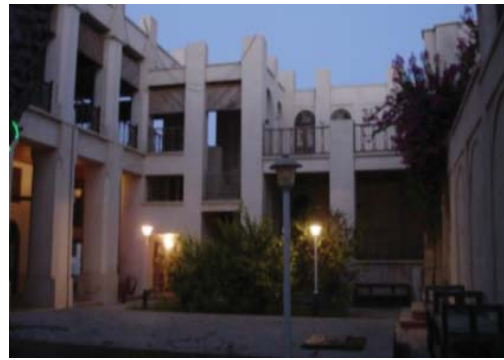
شکل ۱۱. فضای باز مرکزی - حیاط

عمومی» به دالان ورودی بنا «فضای نیمه خصوصی» صورت گرفته و سپس با چرخشی ورود به حیاط و فضای خصوصی «اتاق ها» را مؤثر می سازد. فضای ورودی و مکث به صورت فضایی دالانی شکل است که عرصه نیمه خصوصی این بناها را تشکیل می دهند (شکل ۱۴).