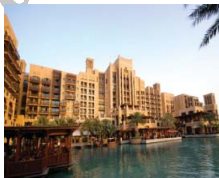
شکل ۲۷. دبي - جميره، نماي هتل جديد ميناالسلام، معماری بر گرفته از بافت قديم بستکيه با استفاده از مصالح نو