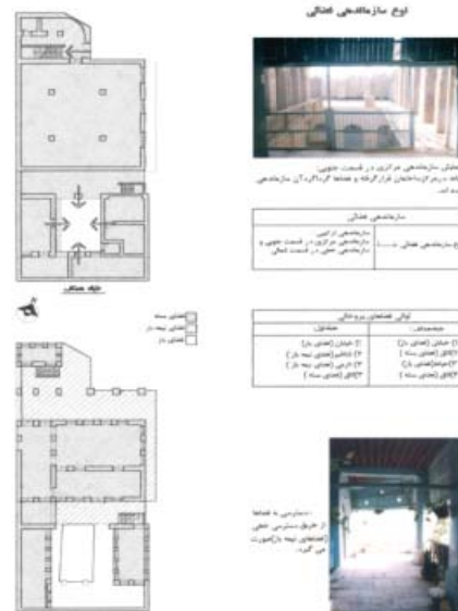
شکل ۱۳. سازماندهی فضایی در خانه مهربان، بافت قدیم بوشهر، محله بهبهانی