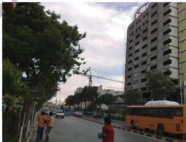
شکل ۲. نمونه‌ای از احداث ساختمان‌های بلند مشرف به حرم رضوی