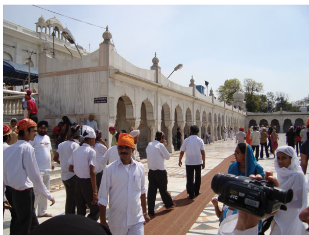
شکل ۶. معبد سیک‌ها (هند)