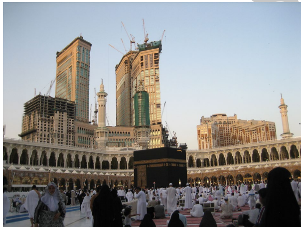
شکل ۱. مکه‌ی مکرمه (ساختمان‌های «بی‌ادبی» که یونسکو به آن اعتراض نمی‌کند)

میراث فرهنگی: توجه شود که میراث فرهنگی علاوه بر همه‌ی ویژگی‌هایی که برایش ذکر می‌شود، یک سرمایه‌ی اجتماعی و فرهنگی است. میراث فرهنگی سرمایه‌ی اولیه برای توسعه و پیشرفت فرهنگ و زمینه‌های وابسته به آن است. و این همان چیزی است که در دوران جهانی‌سازی جوامعی که می‌خواهند هویت خود را حفظ کنند سخت به آن محتاج هستند. این زمینه، به شدت متأثر از بیگانگان است و معیاری وجود ندارد. مثلاً مقایسه کنید، آنچه را که در اصفهان بر میدان نقش جهان رفته است، با اوضاع مکه‌ی مکرمه و مشهد مقدس را. در مورد میدان نقش جهان، علی‌رغم فاصله‌ی نسبتاً زیاد و حتی عدم سیطره‌ی ساختمان جهان‌نما بر میدان، با توجه به اعتراض