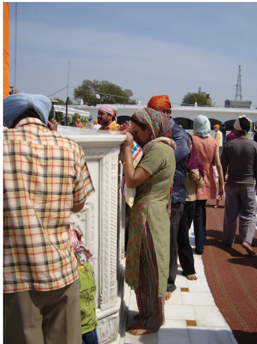
شکل ۹. رعایت آداب ورود به معبد سیکها با پاهای برهنه و سر پوشیده