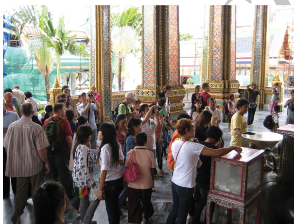
شکل ۷. معبدی بودایی (تایلند)