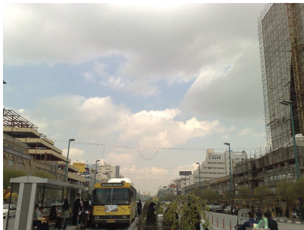
شکل ۳. نمونه‌ای از احداث ساختمان‌های بلند مشرف به حرم رضوی (ع)