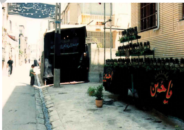
شکل ۵. فضای نامناسب تکیه (فقدان فضای مناسب در محله، مردم را به برپایی حداقل‌ها سوق می‌دهد)