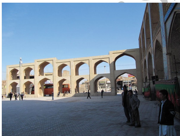
شکل ۴. فضای مناسب تکیه (یا حسینیه) برای برپایی آیین‌ها و حضور در همه‌ی سال