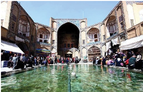
شکل ۳. آب‌نمای مقابل بازار قیصریه