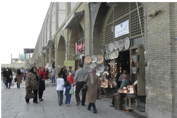
شکل ۵. بدنه تجاری میدان نقش جهان