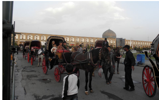
شکل ۲. حضور کالسکه‌ها در میدان نقش جهان