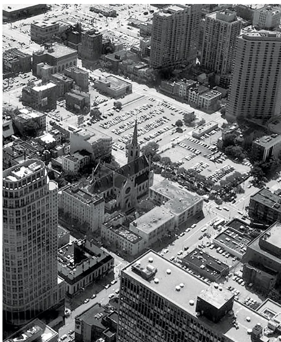
شکل ۵. عناصر خط آسمان شهری دوران مدرن و ارتباط آن با عناصر خط آسمان شهرهای پیش مدرن.

جدول ۲. مقایسه میان خط آسمان شهری پیش مدرن و مدرن