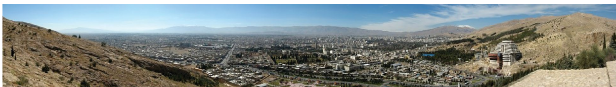
شکل ۲. نقش نیروهای طبیعی در خط آسمان شهری: شیراز، دروازه قرآن