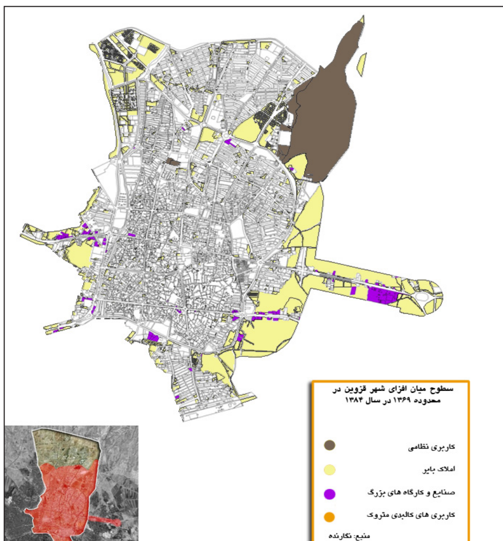
شکل ۲. سطوح میان‌افزای شهر قزوین در محدوده ۱۳۶۹ در سال ۱۳۸۴ (ماخذ نقشه پایه: مهندسین مشاور شهر و برنامه)

۱ و ۲: برابر ۲/۷۹ پروانه بر هکتار و نسبت پروانه به مساحت منطقه برابر ۳,۱۴ پروانه بر هکتار می‌باشد.