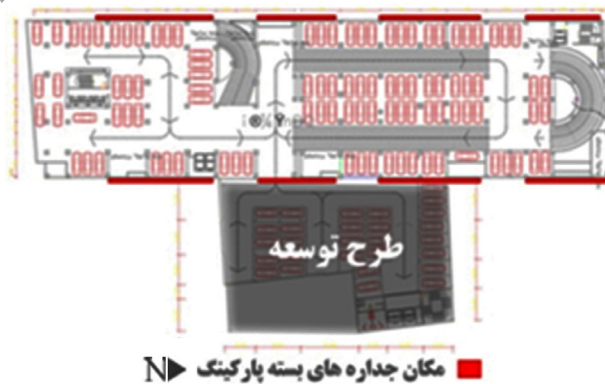
شکل ۴. طراحی بسته و متراکم در جداره‌های پارکینگ

خیابان بوعلی در مرکزیت شهر قرار گرفته که به لحاظ تراکم جمعیتی و ترافیکی در زمره پرازدحام ترین مناطق شهری جای دارد. احداث