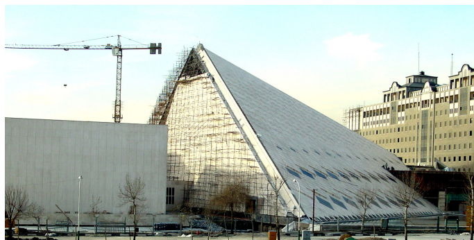
شکل ۵. استفاده از فرم خالص هرم در طراحی ساختمان مجلس شورای اسلامی (ماخذ: ستاوپن، ۱۳۹۵). طراح پروژه در توصیف طرح بیان می‌دارد: «یکی از عوامل مؤثر در شکل‌گیری بنای مجلس، تناسب و ارتفاع و عملکرد دو بنای شمالی و جنوبی بوده است تا این بنا بتواند ضمن استفاده مداوم از دو بنای موجود با محیط اطراف خود نیز هماهنگی کامل را برقرار کند.» (ماخذ: ذکابی، ۱۳۷۸، ۲۹)

در تبیین آن داشته باشد. ارزیابی تأثیر بافت و موقعیت پروژه بر نمود کالبدی آن، از اهداف دیگر چنین پژوهش‌هایی خواهد بود. برای تأمین این چنین هدفی منتقد می‌تواند پس از شناسایی اهداف موردنظر کارفرما، از مردم و یا متخصصان سوال نماید که آیا بنای ساخته شده (شکل ۳) توانسته است به نیازهای از قبل تعیین شده پاسخ دهد یا خیر؟ آیا محیط بعد از ساخته شدن بنای جدید، به محیطی بهتر و مناسب‌تر برای زندگی و گذران اوقات فراغت تبدیل شده یا خیر؟