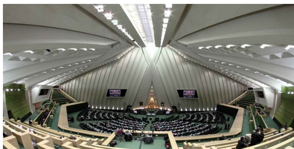
شکل ۴. چشم انداز داخلی ساختمان مجلس شورای اسلامی