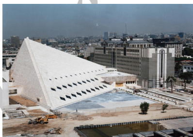
شکل ۳. نمای کلی ساختمان مجلس شورای اسلامی طراحی عبدالرضا ذکایی با همکاری علی سردارافخمی، عباس قریب، مسعود قاضی زاهدی، منصور وکیلی، داریوش فیروزلی و بهروز احمدی (ماخذ: ستاوین، ۱۳۹۵)