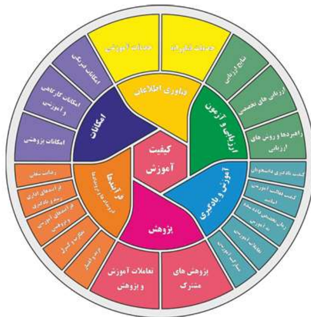
شکل ۱. مدل جامع پژوهش