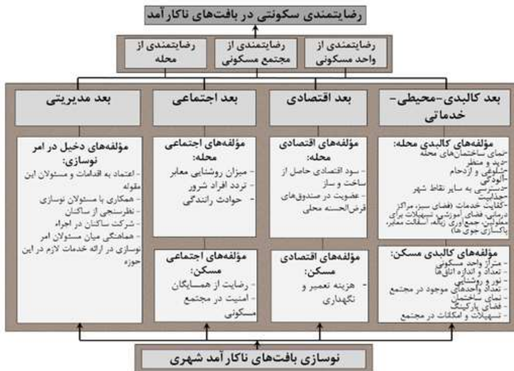
شکل ۲. مدل عملیاتی انجام پژوهش