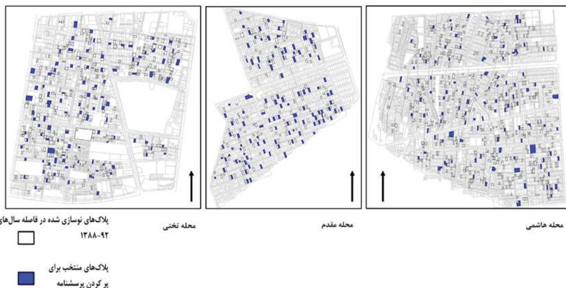
شکل ۳. موقعیت توزیع پرسش‌نامه‌ها در محلات

مسکونی، محله و رضایتمندی کلی سکونتی استفاده شد.