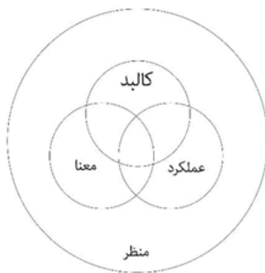
شکل ۱. مدل مفهومی منظر. (منبع: ماهان، ۱۳۹۵، ۱۷۹)

فرهنگی به معنای محصولی انسان‌ساز در یک دوره تاریخی تلقی شود. دستاورد آن، تمدن است، لذا محصول تمدن‌های گذشته متعلق به سرزمین و دوره خاص خود است. بدین گونه مظهر شناخت دوره و دارای ارزش خواهد بود؛ اما اگر تمدن معاصر که به دنبال فرهنگ مدرنیسم شکل گرفته، مشمول این تعریف قرار گیرد، مفهوم فرا سرزمینی پیدا می‌کند (متدین، ۱۳۹۳، ۴۳). تایلر آدر سال ۱۸۷۱ در کتاب «فرهنگ ابتدایی» تعریفی جامع از فرهنگ را ارائه کرده است: «فرهنگ مجموعه پیچیده‌ای است که شامل معارف، اعتقادات، هنرها، صنایع، فنون، اخلاق، قوانین، سنن و بالاخره تمام عادات و رفتار و ضوابطی است که فرد به‌عنوان عضو جامعه، از جامعه خود وام می‌گیرد و در برابر آن جامعه وظایف و تعهداتی را بر عهده دارد» (روح‌الامینی، ۱۳۸۹، ۱۶).