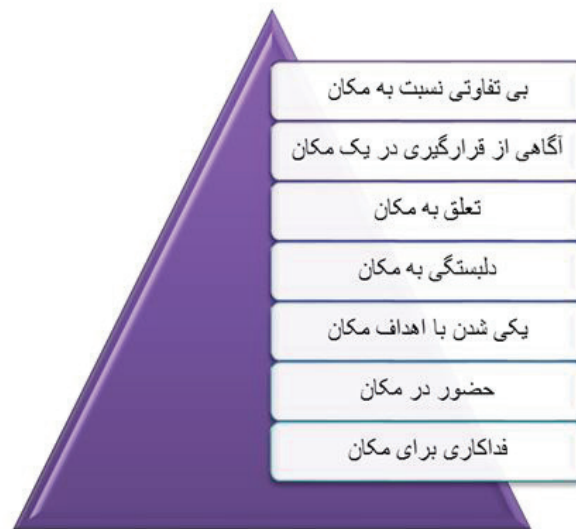
شکل ۱. دستهبندی هفت سطح حس مکان از نظر شامای

عوامل اجتماعی: درباره رابطه فرد و مکان باید گفت، اصولاً روانشناسی محیط نه تنها با بعد کالبدی مکان بلکه با بعد اجتماعی مکان نیز سروکار دارد (Bonnes & Secchiarioli, 1995). ارتباط مثبت بین فرد و مکان کالبدی و احساس رضایت روحی او، با ارتباطات اجتماعی موجود در مکان در رابطه است (Chawla, 1992). فضای اجتماعی مطلوب، سبب افزایش رضایت و ارتباطات غیررسمی (بین مردمی) شده و مشارکت در فعالیت‌های اجتماعی را افزایش می‌دهد و در نهایت موجب ایجاد دل‌بستگی به مکان در افراد می‌شود (Rohe & Stegman, 1994).