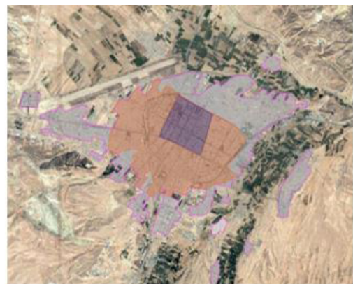
شکل ۱. الگوی کلی روند گسترش شهر بجنورد