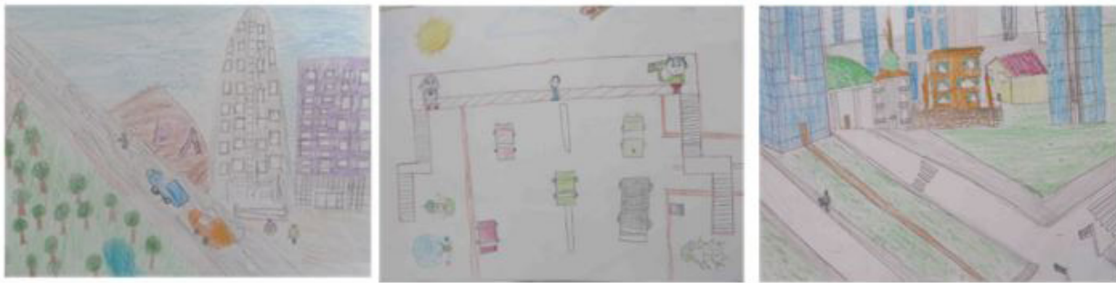
شکل ۲. عناصر کالبدی و ابزار در نقاشی کودکان