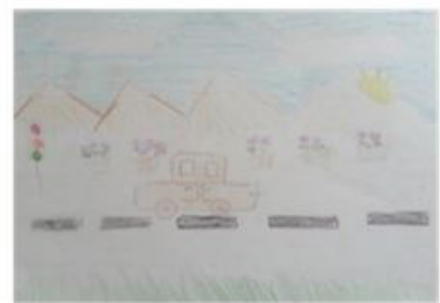
شکل ۱. عناصر طبیعی در نقاشی کودکان