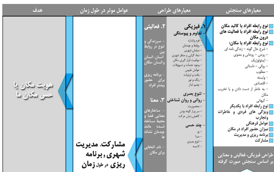
در طول زمان

۱- سنجش وضعیت موجود براساس معناهای ساخته شده در ذهن انسان با توجه به حس مکان انسان به طور مثال در این مرحله به بررسی نوع رابطه انسان با کالبد مکان پرداخته می شود. هدف از این بررسی، دریافت نظرات و دیدگاه های استفاده کنندگان در ارتباط با عناصر مختلف کالبدی مکان می باشد. نتایج حاصل از این دیدگاه ها و نظرات، بیان گر کالبد های مشترک، بارزو مشخص از دید استفاده کنندگان و سپس بهره گیری از عناصر و اجزای موجود و طراحی براساس آن عناصر می باشد.