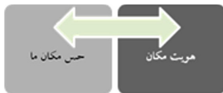
تصویر ۵- مدل هویت مکان و حس مکان.

در نهایت این گونه می‌توان بیان نمود که هویت مکان