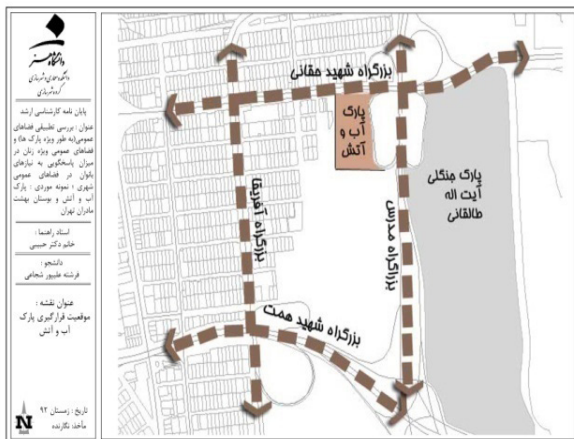
تصویر ۴- موقعیت پارک آب و آتش.

بوستان بهشت مادران که در سال ۱۳۸۷ برای استفاده بانوان افتتاح شده و یکی از پنج بوستان ویژه بانوان در سطح تهران است، با مساحت تقریبی ۲۰ هکتار در منطقه سه تهران قرار گرفته و توسط بزرگراه حقانی در غرب، بزرگراه رسالت در جنوب، خیابان کاویان غربی در شمال و بافت مسکونی محله‌ی سیدخندان در شرق محدود شده است. این مجموعه دارای امکاناتی همچون خانه فرهنگ حوراء شامل کلاس‌های آموزشی متنوع، سالن چندمنظوره ورزشی از قبیل کلاس‌های آموزشی والیبال، بسکتبال، فوتسال، ایروبیک و ...، خانه سلامت مادر که برگزارکننده کلاس‌های آموزشی سبزی‌کاری در منزل، گیاهان آپارتمانی و فضای سبز عمودی می‌باشد. همچنین دارای زمین بازی کودکان، زمین اسکیت، ایستگاه روزنامه‌خوانی، رمپ معلولین، بوفه و فست‌فود، دستگاه‌های ورزشی، آلاچیق، وسایل ورزشی کودکان، کتابخانه، خانه اسباب‌بازی کودکان و ... بوده و با فرض ایفای نقش منطقه‌ای راه‌اندازی شده است.