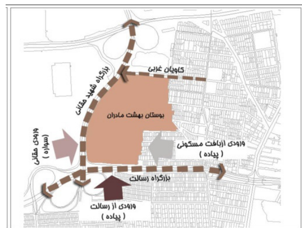
تصویر ۳- موقعیت بوستان بهشت مادران.

اجتماع‌پذیری: نتایج نشان می‌دهد بیشتر مراجعه‌کنندگان به بوستان بهشت مادران، چندروز در ماه به این فضا مراجعه