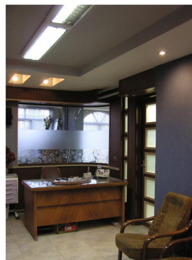
تصویر ۳- ارتباط فضای انتظار با میز پذیرش و اتاق دندانپزشک.