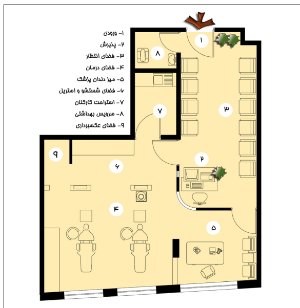
تصویر ۲- پلان مطب دندان پزشکی پس از تغییرات.

ازدحام بر ۲ دسته است (Eroglu, 2005): ۱- ازدحام و شلوغی ناشی از حضور افراد ۴۴ - تراکم عملکردی ۴۵ (Eroglu, 1986) ۲- ازدحام فضایی ۴۶ - تراکم فضایی ۴۷ (Machleit, Eroglu, 2000) تراکم عملکردی و فضایی هر دو ناشی از توزیع نامناسب کاربران و مخاطبان در حوزه فعالیت، جانمایی نامناسب حوزه