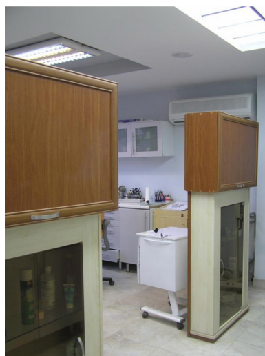
تصویر ۵- جداسازی بخش درمانی از فضای شستشو و استریل.