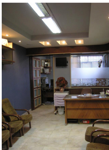
تصویر ۴- ارتباط فضای انتظار با میز پذیرش و اتاق دندانپزشک.