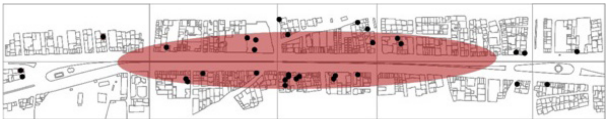
تصویر ۳- نقشه توزیع فعالیت های تولیدی (کد ۱) خیابان امام خمینی شهر هشتگرد.