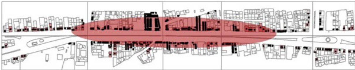
تصویر ۵- نقشه توزیع فعالیت های خرده فروشی (کد ۳) خیابان امام خمینی شهر هشتگرد.

در حال حاضر فعالیت پذیرایی بسیار محدود است اما از حیث پراکنش این کاربری، چنین به نظر می رسد که جز در دو مورد که نوعی نزدیکی بین آنها دیده می شود، به طور کلی این فعالیت کاملاً پراکنده است و سطح بیضی بزرگ تری را به این دلیل دارد. با این وجود، نسبت مراکز میانه خیابان از سایر نقاط بیشتر است. شایان ذکر است که مراکز پذیرایی در نیمه جنوبی خیابان در جوار خیابان و در نیمه شمالی این فعالیت به درون بافت نیز کشیده شده است. به نظر می رسد این پراکنش بستگی به شیوه زندگی مردمی دارد که بیشتر متعلق به طبقه متوسط ساکن بافت های طراحی شده بالای خیابان ساکن هستند. در کل باید گفت نحوه پراکنش این