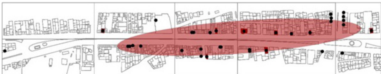
تصویر ۸- نقشه توزیع فعالیت های واسطه گری (کد ۶) خیابان امام خمینی شهر هشتگرد.