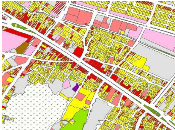
تصویر ۲- خیابان امام خمینی در شهر هشتگرد

اول، تغییرات در تنوع بیشتر فعالیت و تخصصی شدن امور: بر پایه آمار سراسری کارگاه‌های شهر هشتگرد در سال ۱۳۷۳ خیابان امام خمینی در مقیاس مرکز شهر بسیار کم تنوع است و در مجموع ۴۰ کد فعالیت در شهر هشتگرد استقرار دارند، اما بررسی انواع فعالیت‌ها در ۱۳۹۰ در خیابان امام خمینی نشان می‌دهد، در این سال خیابان ۶۲ نوع کد فعالیت وجود دارد که در مقایسه با سال ۱۳۷۳ برابر ۲۲ نوع فعالیت به فعالیت‌های خیابان افزوده شده است. فعالیت‌ها متنوع‌تر و در امور تولیدی، عمده‌فروشی، پذیرایی و واسطه‌گری دو برابر شده است. اما همه فعالیت‌های طبقه‌بندی‌های مذکور یکسان رشد نمی‌کنند، ساختار نظام فعالیت‌ها به لحاظ کیفی تغییرات عمیقی کرده است. ایجاد فعالیت‌های تولیدی در زمینه تولید پوشاک، چاپ و کاغذ، جواهرآلات، و پخش عمده دخانیات و ظروف یکبار مصرف، خرده‌فروشی پلاستیک، موبایل، مبلمان، لوازم پزشکی، لوازم دخانیات، و وسایل اداری، مراکز پذیرایی مانند: رستوران، کافی‌شاپ، آبمیوه‌فروشی، غذاهای خانگی، تعمیرات خانه، تعمیرات موبایل، خدمات انبارداری، ورزشی، فرهنگی، تزیینات، و واسطه‌گری ارز و سکه اهمیت زیادی در ساختار نظام فعالیت نشانه دامنه تغییر و رشد تنوع و تخصصی‌تر شدن امور دارد. از سوی دیگر این تغییر نشانه تغییر سطح انتظارات مردم و افزایش کیفیت زندگی است. این موضوع در زیر بیشتر بررسی می‌شود.