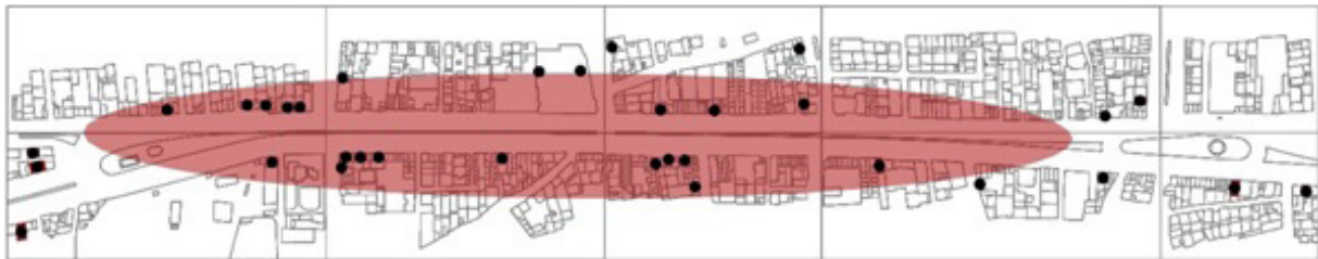
تصویر ۶- نقشه توزیع فعالیت های پذیرایی (کد ۴) خیابان امام خمینی شهر هشتگرد.