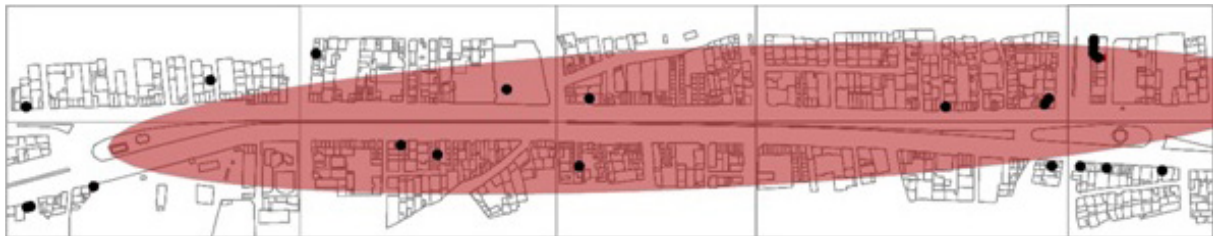
تصویر ۷- نقشه توزیع فعالیت های تعمیرات فنی (کد ۵) خیابان امام خمینی شهر هشتگرد.