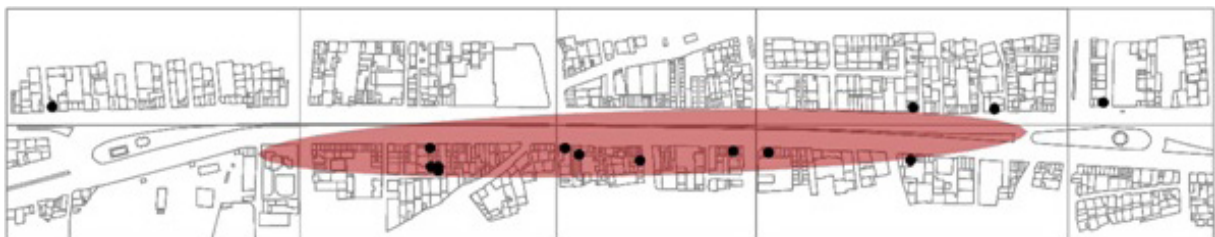
تصویر ۴- نقشه توزیع فعالیت های عمده فروشی (کد ۲) خیابان امام خمینی شهر هشتگرد.