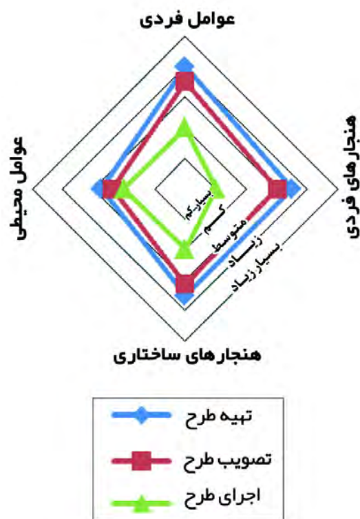
تصویر ۲- مقایسه مطلوبیت مؤلفه‌های رویکرد محتوایی تصمیم‌گیری اخلاقی در فرایندهای تهیه تا اجرای طرح.

با بررسی تصویر ۲، می‌توان به مشابهت نسبی مطلوبیت فرایندهای تهیه و تصویب و اختلاف قابل توجه فرایند اجرا با آنها در تمام مؤلفه‌ها اشاره نمود. همچنین در بین عوامل مؤثر، عوامل فردی بیشتر از عوامل محیطی مورد توجه بوده است و