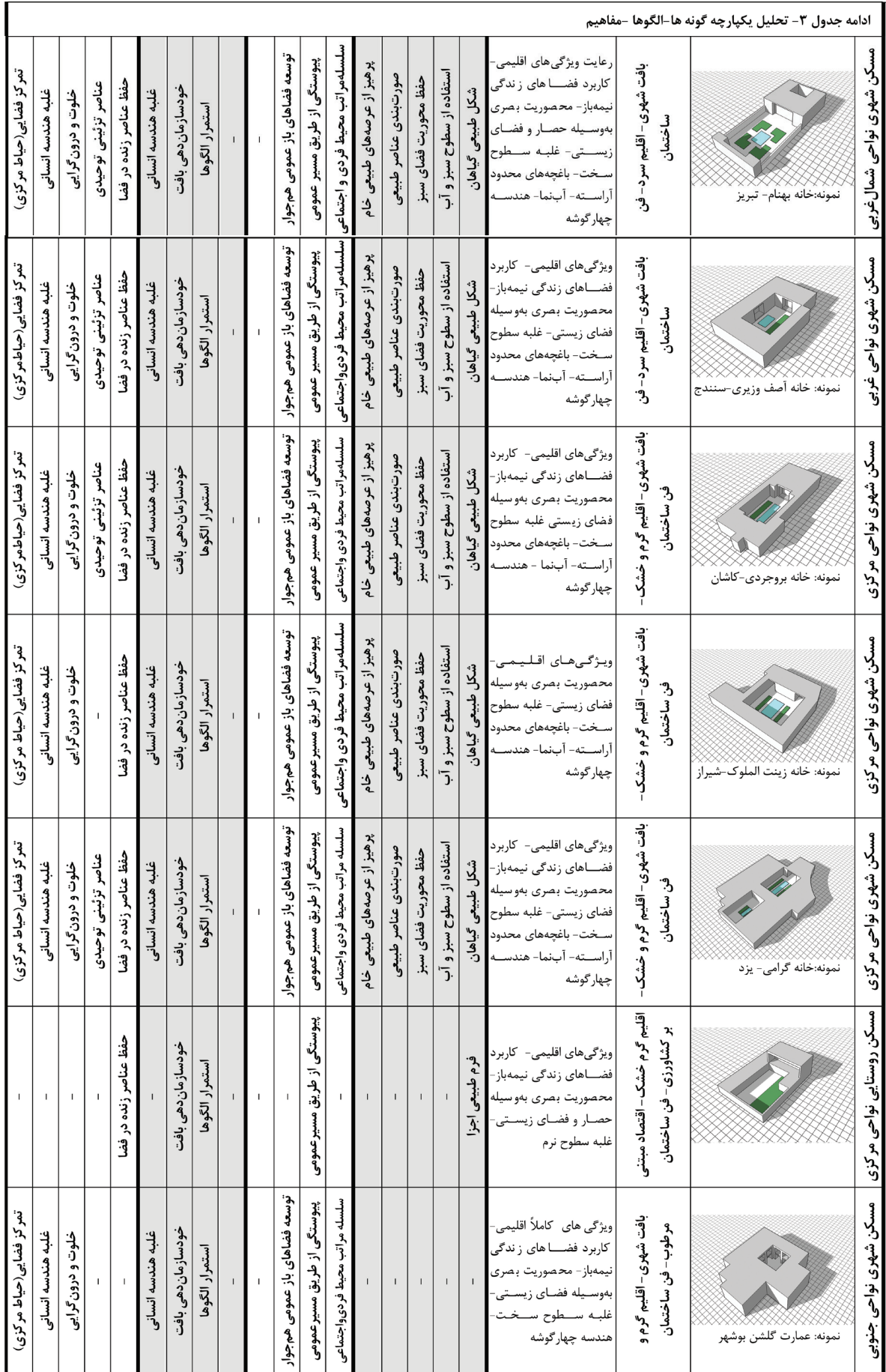
ادامه جدول ۳- تحلیل یکپارچه گونه ها-الگوها-مفاهیم