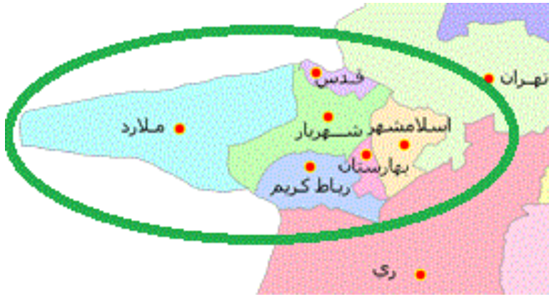
شکل ۲-۲: موقعیت جغرافیایی شهرستان‌های منطقه غرب استان تهران

عاهده دارد که شش شهرستان اسلامشهر، بهارستان، رباط کریم، شهریار، شهر قدس و ملارد را دربر می گیرد.